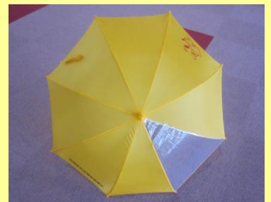
『新入学児童置き傘事業』↑