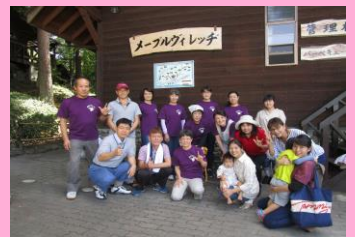
『吉岡町手話サークルぶどうの会』↑