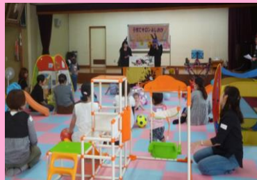
←『子育てサロンよしおか』